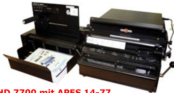
HD 7700 mit APES 14-77

Die APES 14-77 stapelt die gestanzten Lagen nach vorne ab. Die Glattstoßeinrichtung erleichtert die Weiterverarbeitung.